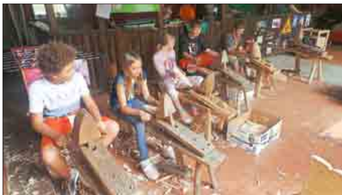
Holzschindeln schnitzen im Jugendclub Uhlstädt (weitere Bilder unter www.uhlstaedt-kirchhasel.de/Aktuelles/MobileJugendarbeit )