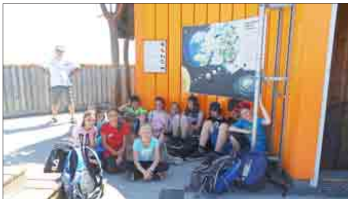
Besuch des Baumkronenpfades bei Bad Langensalza (weitere Bilder unter www.uhlstaedt-kirchhasel.de/Aktuelles/MobileJugendarbeit )