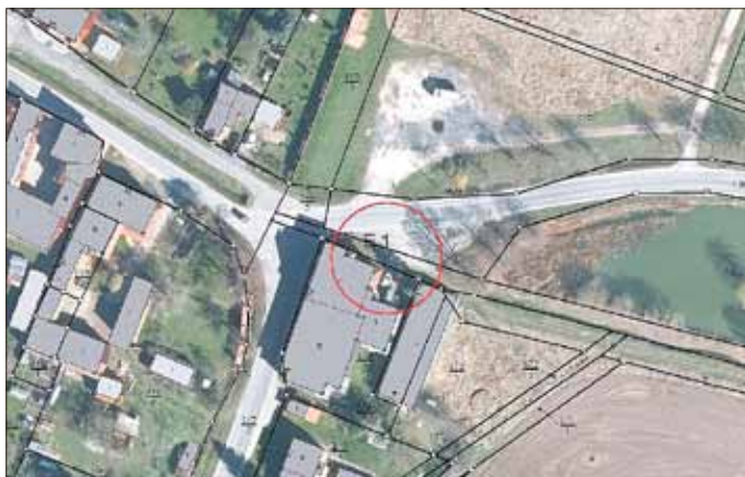
Geltungsbereich der Ersatzmaßnahmen im OT Engerda

Der beiliegende Übersichtsplan stellt die Lage des Geltungsbereiches dar und dient der allgemeinen Information.