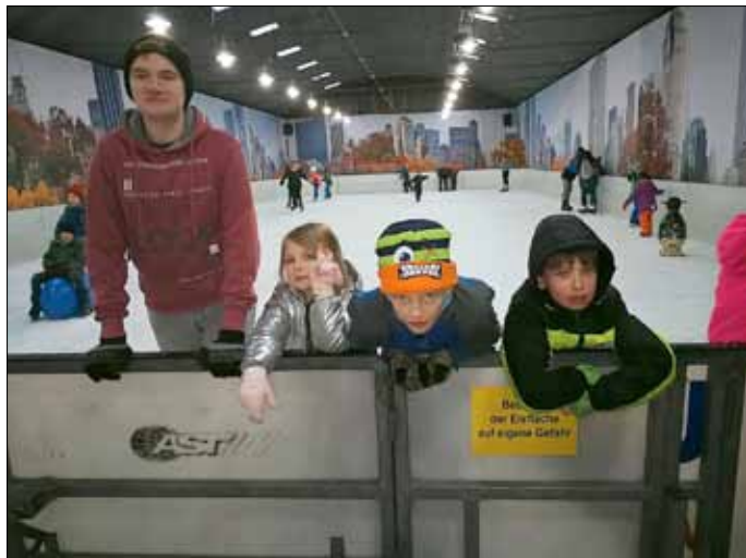
Verschnaufpause in der gut gefüllten Eishalle Neustadt

So wenig Ferien und so viel erlebt! Die Bilder sagen mehr als viele Worte.