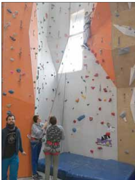
Das Dreierteam aus Uhlstädt in der Kletterhalle

Das Holzschindeldach für das Regal an der Spechtschmiede ist fertig gestellt. Nutzen konnten es bereits die Teilnehmer des 3-tägigen Wintercamps des Jugend- und Stadtteilzentrums Gorndorf . Die nächste Mitmach-Aktion ist für die Osterferien geplant, Anmeldungen werden bereits entgegengenommen.